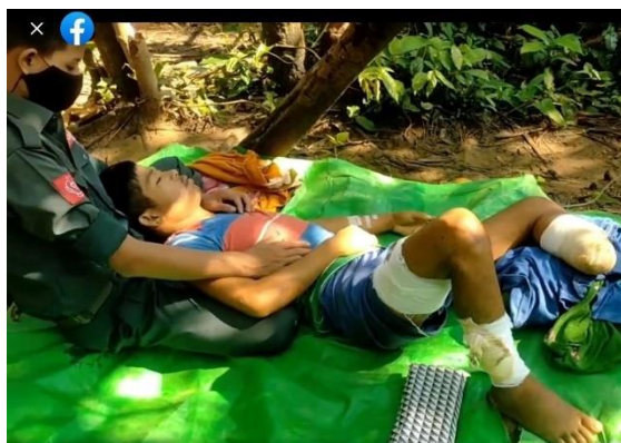
An Arakan Army fighter helps a junta soldier wounded in a regime airstrike.

In a video released by the AA, a sergeant wounded in the airstrike who has been in the Myanmar military for over 20 years said he felt abandoned despite his loyal service.