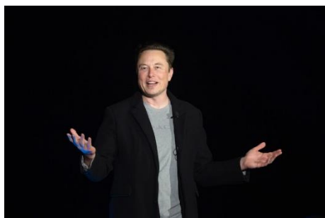
Elon Musk in February.

Activists in Myanmar have asked SpaceX and Tesla founder Elon Musk to provide uncensored internet across the country amid the junta's shutdowns in anti-regime strongholds.