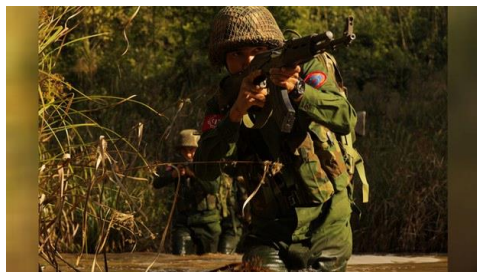
ရက္ခိုင့်တပ်တော် AA တပ်ဖွဲ့ဝင်တချို့အား တွေ့ရစဉ်။ (ယခင်ပုံအဟောင်း)

ရခိုင်ပြည်နယ် ကျောက်တော်မြို့နယ်နဲ့ ပုဏ္ဏားကျွန်းမြို့အစပ် ရန်ကုန်-စစ်တွေ ကားလမ်းမ ပေါ်မှာ စက်တင်ဘာလ ၂၉ ရက် ဒီနေ့မနက် ၁၁ နာရီခွဲလောက်ကစလို့ စစ်ကောင်စီတပ်နဲ့ ရက္ခိုင့်တပ်တော် (AA) တို့ တိုက်ပွဲ ပြင်းထန်နေတယ်လို့ ဒေသခံတွေက RFA ကို ပြောပါတယ်။