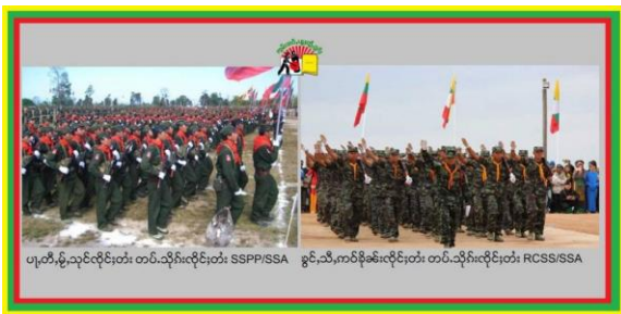
RCSS & SSPP

သျှမ်းပြည်တောင်ပိုင်း လဲချားမြို့နယ်တွင် အာဏာသိမ်းစစ်ကောင်စီနှင့် ငြိမ်းချမ်းရေးတွေ့ဆုံဆွေးနွေးခဲ့သည့် တိုင်းရင်းသားလက်နက်ကိုင်တပ်ဖွဲ့အချင်းချင်း တိုက်ပွဲဖြစ်ပွားသောကြောင့် စစ်ရှောင်များ ထွက်ပြေးတိမ်းရှောင်ခဲ့ရကြောင်း စုံစမ်းသိရသည်။