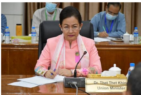
စစ်ကောင်စီခန့်ဝန်ကြီး ဒေါ်သက်သက်ခိုင်

သူသည် နေပြည်တော်တွင်သာ အနေများသော်လည်း သူ၏မိသားစုသည် ထိုအိမ်တွင် နေထိုင်နေဆဲဖြစ်သည်။