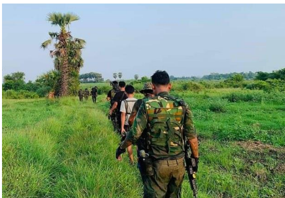
Taze township’s People’s Defense Force.

More than 800 houses in 20 villages have been destroyed by junta troops and nine civilians killed over the past two weeks in junta raids on Taze township in Myanmar’s Sagaing region according to locals.