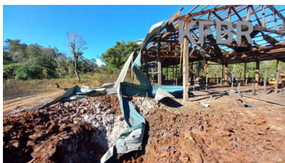
A hole made by one of four bombs dropped on the Ree Khee Bu IDP camp

Other problems were also reported, especially among children, who made up well over half of the camp’s population.