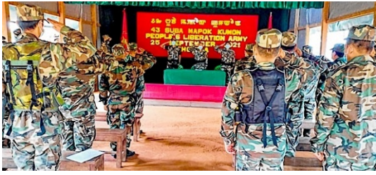
PLA တပ်ဖွဲ့ဝင်များ (ဓာတ်ပုံ – Imphal Free Express)

ပြီးခဲ့သည့် ၂၀၂၁ နိုဝင်ဘာလတုန်းကလည်း မြန်မာနိုင်ငံဘက်မှလာသော ကသည်း PLA ပြောက်ကျားများက အာသံရိုင် ဖယ်တပ်ကို မဏိပူရပြည်နယ်၊ ချူရာချန်ပါခရိုင်တွင် ခြံခိုတိုက်သောကြောင့် အိန္ဒိယစစ်တပ်မှ ဗိုလ်မှူးကြီး ၁