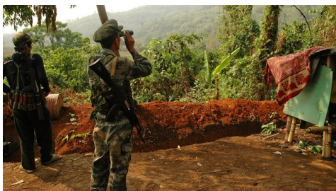
(ကချင်လွတ်မြောက်ရေးတပ်မတော် (KIA) တပ်ဖွဲ့ဝင်တစ်ဦး၏ ကျွမ်းကျင်မှု (၂၀၂၁ မေ ၁၂ ရက်နေ့က တွေ့ရစဉ်)

စစ်ကောင်စီတပ်ဟာ ပူတာအိုမြို့ကနေ စစ်သည်အင်အားတွေကို အင်စီယာန် ရွာနားက ရှိန်ဂတ်ဘွမ် စခန်းအတွက် ရဟတ်ယာဉ်နဲ့ ပို့ဆောင်ပေးနေတယ်လို့ ဒေသခံတွေက ပြောပါတယ်။