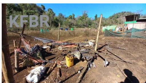
A shelter in the Ree Khee Bu IDP camp is seen after the January 17 airstrike

“I want to build proper tombs for them when the country is at peace. I want to make nice tombstones for them in Moso’s cemetery,” he said.