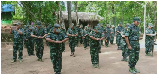
ကသည်းသူပုန်အဖွဲ့ တဖွဲ့ဖြစ်သည့် Kanglei Yawol Kanna Lup – KYKL ကို ၂၀၁၈ခုနှစ်က တွေ့ရစဉ်