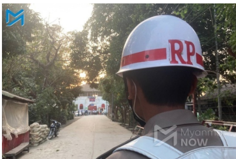
A prison official stands outside of Sittwe prison on February 12

The two-year-old daughter of a female detainee accused of supporting the People's Defence Force (PDF) died in prison in southern Rakhine State's Thandwe Township on Thursday, according to sources.