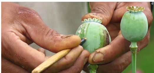
ရမ်းပြည်နယ်တွင် ဘိန်းစိုက်ပျိုးမှု / ကျော်ခ / ဧရာဝတီ

ထိုသို့ ဆိုလိုခြင်းကြောင့် ဒီမိုကရေစီ တက်ကြွလှုပ်ရှားသူများကို သေဒဏ်များအပါအဝင် ပြင်းထန်သော ထောင်ဒဏ်များ ချမှတ်နေသည့် တရားဥပဒေစိုးမိုးရေး အာဏာပိုင်များသည် ထိုကိစ္စများမလုပ်ပါက မူးယစ်ဆေးဝါးမှောင်ခိုမှုကို နှိမ်နင်းနိုင်သည်ဆိုသည့် သဘောသက်ရောက်စေသည်။