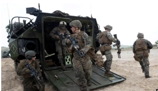
၂၀၂၀ ခုနှစ် Cobra Gold စစ်ဆင်ရေးလေ့ကျင့်နေစဉ်

၂၀၁၂ ခုနှစ်တွင် ပြင်ပကမ္ဘာသို့ မြန်မာ တံခါးပွင့်လာပြီးနောက် ထိုနှစ်စဉ်စစ်ရေးလေ့ကျင့်မှုကို လေ့လာရန် မြန်မာနိုင်ငံကို နှစ်အတန်ကြာ ဖိတ်ခေါ်ခဲ့သည်။ သို့သော် မြန်မာစစ်တပ်သည် မည်သည့် အခါကမျှ ပြုပြင် ပြောင်းလဲရေး လုပ်ဆောင်ခြင်းမရှိသောကြောင့် ထိုသို့ ဖိတ်ခေါ်ခြင်းသည် အငြင်းပွားဖွယ် ဖြစ်ခဲ့သည်။ ထို့နောက် ၂၀၁၇ ခုနှစ်တွင် မြန်မာစစ်တပ်က ရခိုင်ပြည်နယ်မှ ရိုဟင်ဂျာ မွတ်ဆလင်များကို ဖိနှိပ်မှုသည် ကမ္ဘာကို တုန်လှုပ်စေသောအခါ ထို အငြင်းပွားမှုသည် ပိုမို ပြင်းထန်လာသည်။ ထိုနှစ်တွင်း ထိုင်းနိုင်ငံက မြန်မာတပ်ကို စစ်ဆင်ရေးသို့ ဖိတ်ခေါ်လိုက်သောကြောင့် ဝေဖန်မှုအများအပြားကို ဖြစ်စေသည်။ အမေရိကန်အစိုးရကလည်း ထိုဖိနှိပ်မှုသည် လူမျိုးစုသုတ်သင်မှုဖြစ်ကြောင်း ဖော်ပြသောကြောင့် အမေရိကန်ပြည်ထောင်စုတွင်လည်း ဝေဖန်မှုများ ဖြစ်စေသည်။