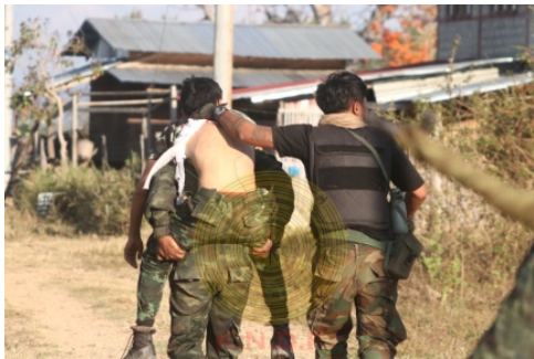
ဒဏ်ရာရသူကို ကယ်ထုတ်လာသော ကရင်နီပီအက်ဖ်တပ်ဖွဲ့ဝင်များ/ KNDF

ဖေဖော်ဝါရီလ ၂၀ ရက်နေ့တွင် စစ်ကောင်စီဘက်က လေကြောင်းမှတစ်ဆင့်၊ လေထီးတပ်သားများနှင့် လက်နက်ခဲယမ်းများ ပို့ဆောင်အားဖြည့်မှုရှိခဲ့ပြီး စစ်ကောင်စီဘက်က ကြိုလိုက်သည့် ၇၅ မမ ဝုံးသီးများအား ကရင်နီမဟာမိတ်ပူးပေါင်းတပ်များက သိမ်းဆည်းမိသည်လည်း ရှိသည်။