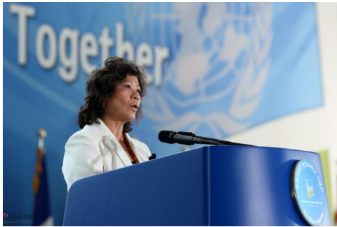
Special Envoy Noeleen Heyzer.

On 21 February, representatives of 20 Myanmar civil society organizations (CSOs) met with the UN Special Envoy of the Secretary-General on Myanmar. The meeting followed a joint statement issued by 247 CSOs in response to the UN Special Envoy's (UNSE's) interview with the Channel News Asia (CNA).