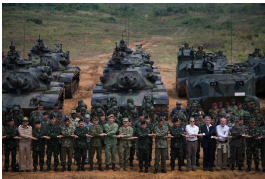
၂၀၁၉ ခုနှစ် Cobra Gold စစ်ဆင်ရေးဖွင့်ပွဲ

ယခုနှစ် စစ်ရေးလေ့ကျင့်မှုတွင် ထုံးစံအတိုင်း ကျည်အစစ်များ၊ ကုန်းရေ နှစ်သွယ်သွားယာဉ်များ၊ ကမ်းတက်ခြင်းနှင့် ဘေးလွတ်ရာသို့ ရွှေ့ပြောင်းပေးသည့် စစ်ဆင်ရေးများ ပါဝင်မည်မဟုတ်ပေ။ အလားတူစွာပင် စစ်ရေးလေ့ကျင့်မှုကို အမည်တွင်စေသည့် မြွေဟောက်သွေးသောက်ခြင်း အစဉ်အလာကိုလည်း ပြုလုပ်မည်မဟုတ်ကြောင်း ဘန်ကောက်ပို့စ် သတင်းစာ၏ အဆိုအရ သိရသည်။