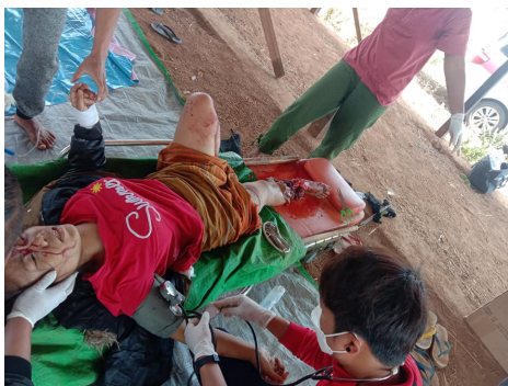
အရပ်သားများလည်း ပြင်းထန်စွာ ဒဏ်ရာရကြသည်

ပြီးခဲ့သည့် ဖေဖော်ဝါရီလ ပထမပတ်အတွင်း စစ်ကောင်စီဒုက္ခကူ ဒုဗိုလ်ချုပ်မှူးကြီး စိုးဝင်းနှင့် စစ်ကောင်စီခန့် ပြည်ထဲရေးဝန်ကြီး ဒုဗိုလ်ချုပ်ကြီးစိုးထွဋ်တို့ ကယားပြည်နယ်မြို့တော် လွိုင်ကော်နှင့် ဘောလခဲမြို့များသို့ ရဟတ်ယာဉ်ဖြင့် သွားရောက်ကာ နယ်မြေခံတပ်နယ်အရာရှိများနှင့် တွေ့ဆုံပြီးနောက် ရှမ်း-ကယားနယ်စပ်တွင် စစ်ကြောင်းထိုးမှု ပြန်လည်ပေါ်ပေါက်လာခြင်းဖြစ်သည်။