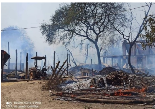
The burned remains of a house in Chaung-U village, Pale Township

According to the Pale PDF, Myanmar army soldiers and plainclothes Pyu Saw Htee members stationed in Zee Phyu Kone and In Ma Htee villages had been raiding and torching homes in other neighbouring communities, and had destroyed more than 2,000 houses in the township.