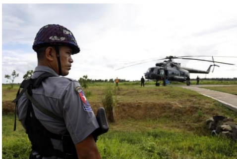
A military helicopter is seen in Maungdaw in September 2017

Multiple military aircraft were seen arriving in Rakhine State's northern Maungdaw Township on Tuesday as battles between the junta's forces and those of the Arakan Army (AA) intensified nearby, locals said.