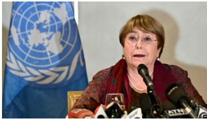
United Nations High Commissioner for Human Rights Michelle Bachelet speaks during a press conference in Dhaka, Bangladesh, Aug. 17, 2022.

At a press conference concluding her four-day visit to Bangladesh, Michelle Bachelet also urged the South Asian nation's government to ratify the International Convention for the Protection of all Persons from Enforced Disappearance.