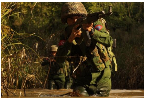
An AA soldier is seen in September 2019

Helicopters were also reportedly seen delivering soldiers to a military base in Maungdaw town, around 40 miles south of the clash site.