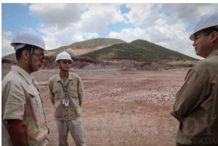
၂၀၁၄ ခုနှစ်က လက်ပံတောင်းတောင် စီမံကိန်းအတွင်း တွေ့ရသည့် တရုတ်ပညာရှင်တချို့

ကြေးနီစီမံကိန်းတွေနဲ့ ပတ်သက်လို့ ဒီလို ပိတ်ဆို့အရေးယူတွေက အာဏာသိမ်းတပ်အပေါ် အမှန်တကယ် ထိခိုက်နစ်နာ စေမှု ရှိ မရှိကတော့ မေးခွန်းထုတ်စရာတွေ ရှိနေပါတယ်။