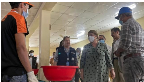
U.N. High Commissioner for Human Rights Michelle Bachelet visits a Rohingya refugee camp in Ukhia, in Bangladesh's Cox's Bazar district, Aug. 16, 2022.

She called on ministers to establish a "more specialized mechanism that works closely with victims, families and civil society to investigate allegations of enforced disappearances and extrajudicial killings," given the "long-standing frustrations at the lack of progress in investigations and other obstacles to justice."