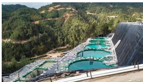
A rare earth mining operation in Kachin state, Myanmar, March 2022.

“Since the 2021 coup, the regime has relied on natural resources to sustain its illegal power grab and with demand for rare earths booming, the military will no doubt be spotting an opportunity to fill its coffers and fund its abuses,” he added.