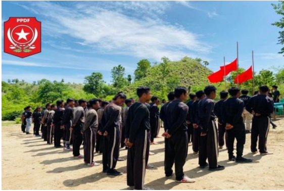
Members of the Pakokku PDF, seen on July 19

The attack, carried out by an alliance of 10 local defence forces, targeted soldiers and members of the military-backed Pyu Saw Htee militia based in the village of Twin Ma, the sources said.