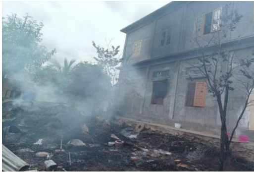
A house destroyed by junta forces following a military raid on the village of Letpan Kyin on August 1

The raid, which targeted the village of Letpan Kyin on August 1, involved both air and ground attacks and also resulted in the deaths of 10 resistance fighters over the next two days, the sources said.