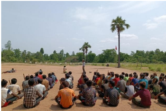
Yesagyo PDF members are seen during a training exercise (Yesagyo PDF)

Maung Shwe Wah | Published on Aug 9, 2022