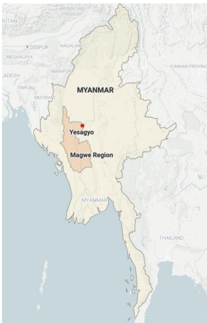
Map indicating the location of Yesagyo Township in Magway Region

We have won a number of battles against the junta not only in Yesagyo, but also in other townships like Myaing, Pauk and Salingyi. In Yesagyo, we managed to seize control of the Pa Khan Nge base and the Ma Eu police station and bridge outpost. We confiscated weapons from the Lin Ka Taw police station on Yesagyo's border with Myaing without suffering any casualties. These achievements were possible only with public support.