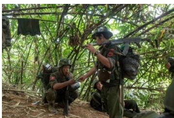
KIA စစ်သားများကို တွေ့ရစဉ်

ကချင်ပြည်နယ် ဖားကန့်မြို့နယ် ဆယ်ဇင်းရွာမှာ ကချင်လွတ်မြောက်ရေးတပ်မတော် (KIA) နဲ့ စစ်ကောင်စီတပ်တို့ ဒီနေ့အထိ နှစ်ရက်ဆက် တိုက်ပွဲပြင်းထန်နေပြီး စစ်ကောင်စီတပ်ဘက်က လေယာဉ်တွေနဲ့ပါ တိုက်ခိုက်တာကြောင့် ဒေသခံ သုံးထောင်ခန့်ကျင် ဘေးလွတ်ရာ ထွက်ပြေး နေရတယ်လို့ ဆယ်ဇင်းဒေသခံတွေက ပြောပါတယ်။