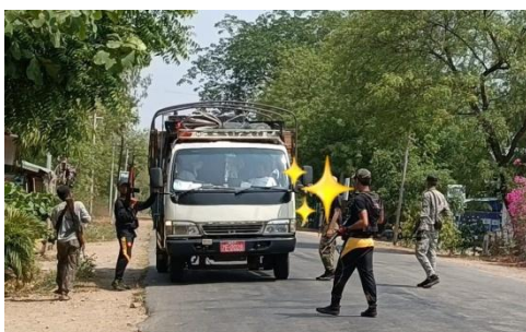
PDF members operate a checkpoint along the road connecting Yesagyo with Chaung-U in Sagaing (Yesagyo PDF)

Education is something we cannot just put aside during these times. We have discussed the operation of schools under the NUG's supervision with the people's board of education in the township. Some of these schools have already opened, in villages far from highways and roads. The places where we still can't open schools are the areas which could still be accessible by the military.