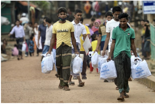
Rohingya at the Kutupalaung refugee camp in Bangladesh, Oct. 6, 2021.

The junta's Ministry of Foreign Affairs said on Feb. 20 that it is readying the return of "displaced persons from Rakhine state." The announcement notably avoided both the use of the term "Rohingya," a mostly Muslim ethnicity that the military says does not exist in Myanmar, and the term "Bengali," which the junta favors and implies the group is originally from Bangladesh.