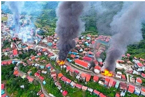
Homes on fire in Thantlang in late October 2021

More than 800,000 people have been displaced across the country since the February 1, 2021, political upheaval, announced the United Nations Office for the Coordination of Humanitarian Affairs (OCHA Myanmar) on February 23.