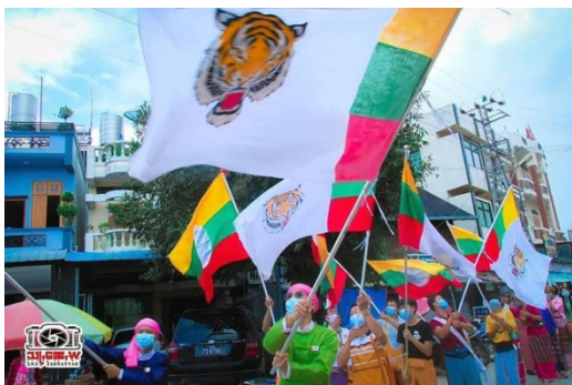
An election campaign activity by SNLD in 2020