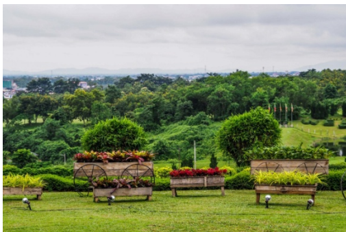
တာချီလိတ်ရှိ စစ်တပ်ပိုင်မြေပေါ်က Regina Resort ကာစီနို နှင့် ဂေါက်ကွင်းလုပ်ငန်း

ထိုလုပ်ငန်းများသည် စစ်တပ်ပိုင်မြေပေါ်ရှိ Regina Resort ကာစီနို နှင့် ဂေါက်ကွင်းလုပ်ငန်း နှင့် Golden Triangle Mountain Resort ဟိုတယ်တို့ ဖြစ်နိုင်ကြောင်း တာချီလိတ်မြို့ရှိ ဒေသခံ လုပ်ငန်း ရှင် တဦးကလည်း ဧရာဝတီသို့ ဆိုသည်။ Regina Golf Club သည် တာချီလိတ်မြို့၏ တခုတည်းသော ဂေါက်ကွင်းဖြစ်သည်။