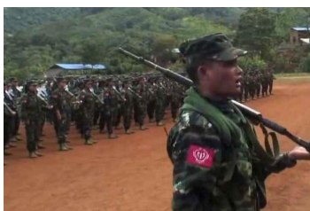
Arakan Army soldiers are seen in a video released by the AA.

The last two years have seen the Arakan Army (AA) strengthen its hold over Rakhine State and extend a number of self-administered zones.