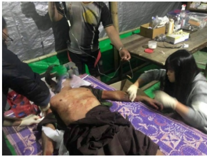
An injured local is seen getting medical treatment after the air attack on Tuesday (KNDF)

On Thursday there were reportedly three more airstrikes on the Nan Mei Khon area between 5:30am and 12:30pm, according to the Karenni Nationalities Defence Force (KNDF).