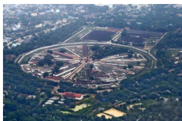
An aerial view of Insein prison in Yangon.

Since the Myanmar military grabbed control of the country in a coup in February 2021, one of their evil methods to break people and fight the opposition is the use of torture.