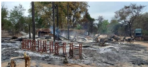
ဝက်လက်နယ်အတွင်းရှိ မီးရှို့ခံရသည့် ကျေးရွာတချို့

အဆိုပါ စစ်ကောင်စီ စစ်ကြောင်းသည် စစ်ကိုင်းမြို့နယ်၊ တလိုင်းကျွန်းကျေးရွာကိုလည်း လက်နက်ကြီးဖြင့် ပစ်ခတ် ဝင် ရောက်ခဲ့သလို ညောင်ပင်ရှည်ကျေးရွာမှ နေအိမ်များကိုလည်း မီးရှို့ဖျက်ဆီးခဲ့ကြောင်း၊ မူးမြစ်ဘေးကျေးရွာများကို တိုက်ပွဲ ဖြစ်ပွားမှုမရှိဘဲ စစ်ကောင်စီက လေကြောင်းရော မြေပြင်တိုက်ခိုက်မှုပါ ပြုလုပ်နေခြင်းကြောင့် ဒေသခံများ ဘေးလွတ်ရာ ထွက်ပြေး တိမ်းရှောင်နေကြရကြောင်း သိရသည်။