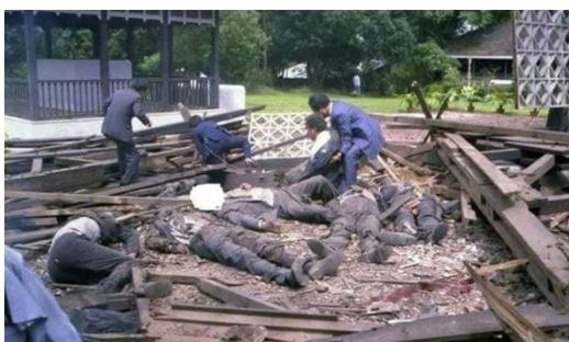
၁၉၈၃ ခုနှစ်၊ အောက်တိုဘာလ ၃ ရက်နေ့ အာဇာနည်ကုန်း ဗိုလ်ချုပ်

ဦးတင်ဦးကို ၁၉၈၀ အထွေထွေ လွတ်ငြိမ်းချမ်းသာခွင့်တွင် လွှတ်ပေးပြီးနောက် ၁၉၈၈ အရေးတော်ပုံ အပြီးတွင် အမျိုးသားဒီမိုကရေစီ အဖွဲ့ချုပ် (NLD) ခေါင်းဆောင်ဖြစ်လာသည်။ ဦးဝင်းထိန်သည်လည်း ဒီမိုကရေစီလှုပ်ရှားမှုတွင် ပါဝင်လာပြီး နိုင်ငံရေးလှုပ်ရှားမှုများတွင် ပါဝင်သောကြောင့် အာဏာရှင်ဟောင်း ဗိုလ်ချုပ်မှူးကြီး သန်းရွှေခေတ်တွင် စုစုပေါင်း ထောင်နှစ် ၂၀ ချခံရသည်။