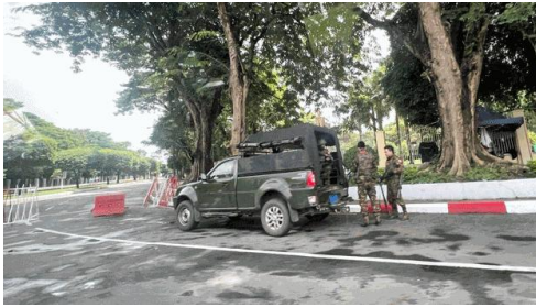
Junta troops prepare to set up a security checkpoints in Yangon, Myanmar, July 19, 2022.