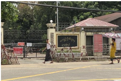
The main entrance of Yangon's Insein Prison, seen in July