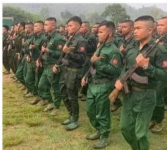
TNLA နှင့် SSPP/SSA

“ဇူလိုင် ၂၇ ရက်နေ့ မနက်ပိုင်းမှာ ဝမ်ဘုံကန်ဘက်ကို TNLA တပ်သားတွေက မူးယစ်အကြောင်းပြပြီး ရွာသား ၄ ဦးကို လာဖမ်းသွားတယ်။ မွန်းလွဲပိုင်းရောက်တော့ ဝမ်ဖိုင်က ရွာသား ၄ ယောက်ကို SSPP/SSA ကဝင်ဖမ်းတယ်။ အဲ့ဝမ်ဖိုင်မှာ ဝင်ဖမ်းတဲ့