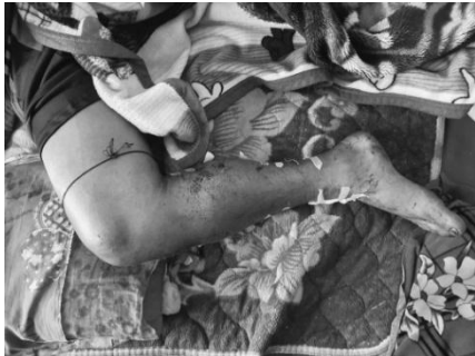
ဆွဲမိုင်းနင်းမိသူ

“ မနေ့က ၃ နေရာလောက်ပေါက်ကွဲမှုဖြစ်တယ်။ မနက် ၉ နာရီက နောင်လုံကျေးရွာမှာ ပေါက်ကွဲပြီးတော့ ပြည်သူတစ်ဦးက ထိသွားတာ။ နေ့လည် ၃ နာရီလောက်မှာ လွိုင်ကန့်ကော်မှာ ထပ်တစ်နေရာပေါက်တယ်လို့ ပြောတယ်။ ပြီးတော့ ညပိုင်းအချိန်မှာ ထပ်တစ်နေရာပေါက်သေးတယ် ” ဟု ၎င်းကဆိုသည်။