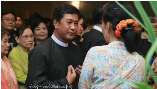
ဓာတ်ပုံ ပုံစာ, နိုင်ငံတော်အတိုင်ပင်ခံပုဂ္ဂိုလ် ဒေါ်အောင်ဆန်းစုကြည်နဲ့ ကိုဂျင်မီ

ဦးဂျင်မီနဲ့ ဦးဖြိုးဇေယျာသော်တို့ သေဒဏ်စီရင်ခံရပြီးနောက်မှာတော့ ဒီလုပ်ရပ်ဟာ နိုင်ငံတကာ၊ အိမ်နီးချင်းနိုင်ငံတွေနဲ့ အာဆီယံအသိုင်းအဝန်းတွေက တိုက်တွန်းနေတဲ့ ငြိမ်းချမ်းစွာဖြေရှင်းဆောင်ရွက်နိုင်မယ့် နိုင်ငံရေးလမ်းကောင်းတွေကို ရင့်ရင့်သီးသီး နှင်းခြေလိုက်တာဖြစ်တဲ့အကြောင်း၊ သေဒဏ်ကို မစီရင်ဖို့ ယဉ်ကျေးတဲ့သံတမန်ရေးနဲ့ နိုင်ငံရေးအသိုင်းဝန်းတွေက မေတ္တာရပ်ခံတဲ့ကြားက သေဒဏ်စီရင်တာဟာ ပြည်သူတွေရဲ့ ဒေါသနဲ့ မခံချင်စိတ်ကို နိုးဆွစိန်ခေါ်လိုက်တာဖြစ်တဲ့အကြောင်း ဒီဖြစ်ရပ်ကြောင့် ပြည်သူလူထုကနေ တုံ့ပြန်လာမည့် နောက်ဆက်တွဲအခြေအနေတွေကို စိုးရိမ်မိတယ်လို့ ရခိုင်အမျိုးသားအဖွဲ့ချုပ်က ဒီနေ့ ထုတ်ပြန်လိုက်ပါတယ်။