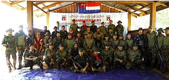
ဇူလိုင် ၁၆ ရက်က ပြုလုပ်သည့် KNDO ဖွဲ့စည်းခြင်း ၇၅ နှစ်မြောက် အခမ်းအနားတွင် ဗိုလ်ချုပ်စောနယ်ဒါးမြကို တွေ့ရစဉ်

ဗိုလ်မှူးချုပ်နယ်ဒါးမြ လက်အောက်ရှိ KNDO တပ်ဖွဲ့ဝင်များသည် ၂၀၂၁ မေလအတွင်း မြဝတီခရိုင်၊ ဝေါလေမြို့၊ ကနဲ လေးကျေးရွာနှင့် မော်ခီးကျေးရွာကို ဆက်သွယ်မည့် အူးဟူချောင်းတံတား တည်ဆောက်ရေးလုပ်ငန်းခွင်မှ အရပ်သား ၂၅ ဦးကို စစ်ကောင်စီတပ်ဖွဲ့ဝင်များနှင့် သတင်းပေးများ ဖြစ်သည်ဆိုသည့် အကြောင်းပြချက်ဖြင့် သတ်ဖြတ်ခဲ့သည်။