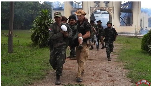
ကယားပြည်နယ် (ကရင်နီ) ဒေသမှ Free Burma Rangers အဖွဲ့ဝင်များအား တွေ့ရစဉ်

စစ်တပ်အာဏာသိမ်းခဲ့တဲ့ ၂၀၂၁ ခုနှစ်ကနေ အခု ၂၀၂၂ ခုနှစ်ထိ တစ်နှစ်ခွဲကျော်ကာလ အထိ တိုင်းရင်းသား ဒေသတွေမှာဖြစ်ပွားခဲ့တဲ့ တိုက်ပွဲတွေအတွင်း Free Burma Rangers အဖွဲ့ဝင် စုစုပေါင်းရှစ်ဦး သေဆုံးခဲ့တယ်လို့ အဲဒီအဖွဲ့က ထုတ်ပြန်ထားပါတယ်။