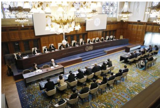
The hearing on ICJ’s judgment on the preliminary objections raised by Myanmar in progress