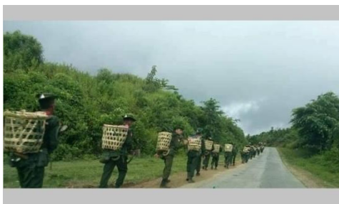
Burma Army troops in Shan State

According to a local who requested anonymity, the Kachin soldiers attacked Infantry Battalion (IB) 276 and Light Infantry Battalion (LIB) 348, under the command of Light Infantry Division (LID) 99. The groups were travelling from Hsai Leang village to Thayetcho, where the slain child and wounded civilian live.