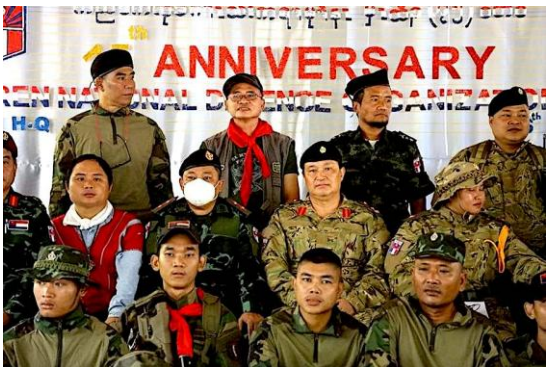
ဇူလိုင် ၁၆ ရက်က ပြုလုပ်သည့် KNDO ဖွဲ့စည်းခြင်း ၇၅ နှစ်မြောက် အခမ်းအနားတွင် ဗိုလ်ချုပ်စောနယ်ဒါးမြစ်ကို တွေ့ရစဉ် / KNDO

ယခုကဲ့သို့ ဗိုလ်ချုပ်နယ်ဒါးမြစ် ကော်သူးလေတပ်ကို တည်ထောင်လိုက်ရာ ၎င်း၏တပ်သည် မည်သည့်ဒေသတွင် အခြေစိုက်မည်နှင့် ပတ်သက်ပြီး မေးခွန်းထုတ်စရာ ရှိနေကြောင်း ကရင်ပြည်နယ်တောင်ပိုင်းအခြေစိုက် KNU အဆင့် မြင့်အရာရှိတဦးက ပြောသည်။