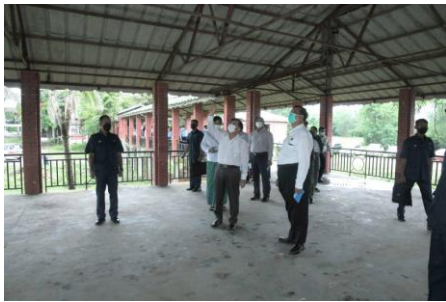
Min Aung Hlaing visits the main hall where the national convention was held to draft the 2008 Constitution on June 8, 2022.

However, there are likely more pressing reasons for the preservation of the site than posterity. With the military regime facing nationwide armed resistance prompted by last year's coup, the hasty renovation of the site – which was built to host the National Convention to draft the 2008 Constitution – may be more to do with the fact that the clock is ticking for Min Aung Hlaing.