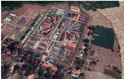
An aerial view of Tharrawaddy Prison in central Myanmar's Bago region in an undated photo.