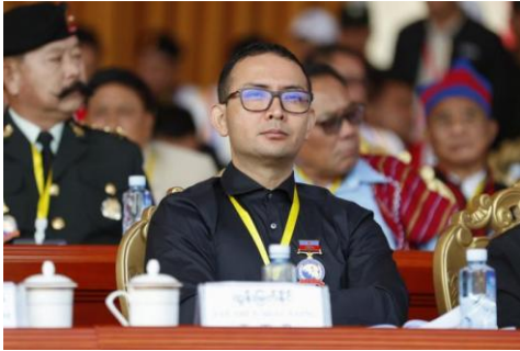
Tun Myat Naing, commander-in-chief of the Arakan Army (AA).

The AA's ideology is based on what they call The Rakhita Way.