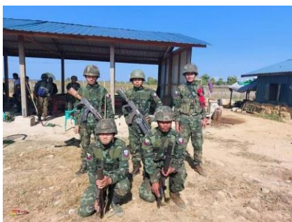
San Pya Militia Force

Two members of the Kachin Independence Army (KIA) are dead and two wounded after a People’s Militia Force (PMF) attacked their camp near a gold mine located in an area controlled by KIA Battalion 14 (Brigade 2) on the Tanai – Lido road.