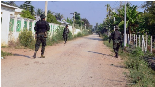
KNDF တပ်ဖွဲ့ဝင် တချို့ကိုတွေ့ရစဉ်

ကယားပြည်နယ် နန်းမယ်ခုံမြို့ကို စစ်ကောင်စီတပ်က အင်အားသုံး ထိုးစစ်ဆင် လာတဲ့ အတွက် ကာကွယ်ရေး အဖွဲ့တွေက ဖေဖော်ဝါရီလ ၂၄ ရက် မနက်က ဆုတ်ခွာပေးလိုက် ရတယ်လို့