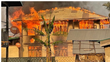
Homes burn in Kayah state's Loikaw township following junta airstrikes, Feb. 23, 2022.

Fighting between Myanmar junta troops and local militias has intensified along the border of Shan and Kayah states, leaving at least 10 civilians and 80 junta soldiers dead, sources in the region say.