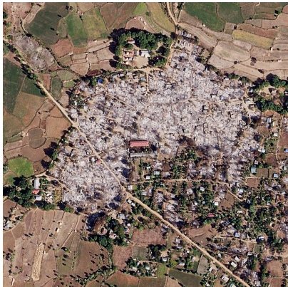
An aerial view of Pale township's Chaung Oo village following an arson attack by pro-junta forces, Feb. 18, 2022.

The junta has dismissed reports of the Pyu Saw Htee’s existence, although it acknowledges that the military is “forming native militia groups” in response to “internal insurgency movements” in play since Myanmar gained its independence from Britain in 1948.