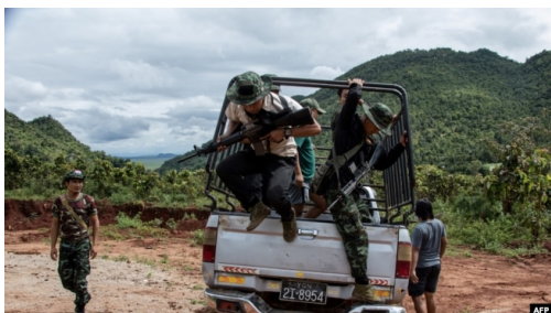
FILE - Members of the Karenni Nationalities Defence Force and Karenni Army at a checkpoint near Demoso, in Myanmar's eastern Kayah state, Oct. 19, 2021.

Other Chin communities in the United States have set up their own groups to raise funds for militias affiliated with their particular tribes.