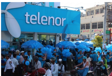
A Telenor showroom in Mandalay in September 2015

Myanmar’s junta is refusing to allow Telenor executives to leave the country pending the finalisation of the sale of the company’s telecommunications operations, the group’s leadership said.