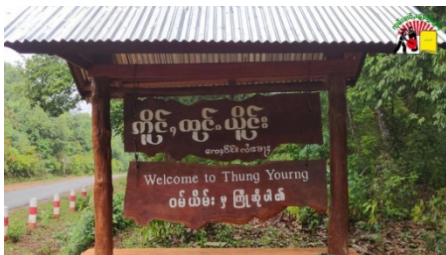
ဝမ်ယိမ်းကျေးရွာ

သျှမ်းပြည်တောင်ပိုင်း လဲချားမြို့နယ် ဝမ်ယိမ်းကျေးရွာအုပ်စုတွင် ဒေသခံ တချို့ စိုးရိမ်စိတ်ဖြင့် နေရပ်သို့ ပြန်လာနေပြီဖြစ်ကြောင်း စုံစမ်းသိရှိရသည်။