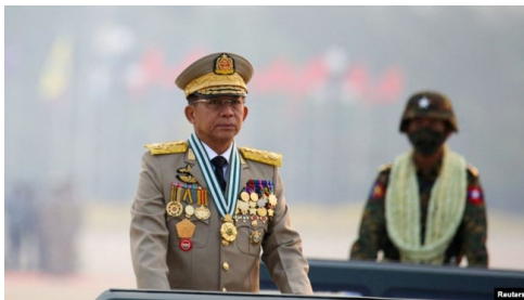
FILE - Myanmar's junta chief Senior General Min Aung Hlaing presides over an army parade on Armed Forces Day in Naypyitaw, Myanmar, March 27, 2021.

The CDF-Hakha Support Team said some Chin have gone back from the United States as well.