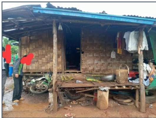
Zup Aung IDP Camp

Three women were killed and a man wounded by a regime artillery strike on an internally displaced persons (IDPs) camp near Kutkai in northern Shan State on Friday. The Burma Army (BA) indiscriminately fired shells from a strategic hill camp, striking Zup Aung IDP camp at 10am.