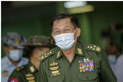
Min Aung Hlaing.

The Myanmar junta calls them “peace talks” but the aim appears to be to keep potential enemies at bay.