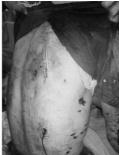
မိုင်းနင်းမိသူ

သျှမ်းပြည်မြောက်ပိုင်း သီပေါမြို့နယ် ထန်စန့်ကျေးရွာမှ ဒေသခံအမျိုးသားတစ်ဦးသည် တောလိုက်နေစဉ် အတွင်း လက်ကျန်မြေမြုပ်မိုင်းနင်းမိကာ သေဆုံးသွားခဲ့ရကြောင်း သတင်းသိရသည်။