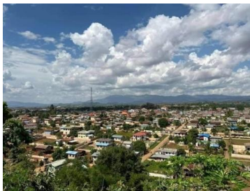
ဆိုက်ခေါင်

သျှမ်းပြည်နယ်တောင်ပိုင်း၊ ဆီဆိုင်မြို့နယ် ဆိုက်ခေါင်စံပြကျေးရွာအနီးရှိ ပအိုဝ်းပြည်သူ့စစ် (PNO) က ပစ်ခတ်လိုက်သည့် အသက် (၂၂) နှစ်အရွယ်ရှိ အမျိုးသမီးတစ်ဦးသေဆုံးသွားကြောင်း စုံစမ်းသိရှိရသည်။