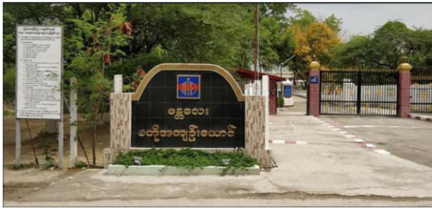
Obo Prison in Mandalay.

More than 100 political prisoners were locked in a putrid fish-paste warehouse in Mandalay's Obo Prison for celebrating Daw Aung San Suu Kyi's 77th birthday on Sunday, causing vomiting and dizziness.