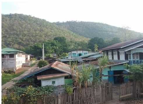
ဖယ်ခုံနေအိမ်

သျှမ်းပြည်တောင်ပိုင်း ဖယ်ခုံမြို့နယ်အတွင်းရှိ စစ်ကောင်စီ နှင့် ပအိုဝ်း ပြည်သူ့စစ် (PNO) တို့သည် စစ်ရှောင်ပြည်သူ နေအိမ်များထံ ပစ္စည်းဝင်ယူသွားကြောင်း စုံစမ်းသိရသည်။