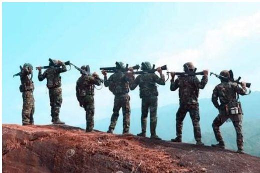
Frontline KIA Group

The Kachin Independence Army (KIA) have launched multiple raids on a convoy of 80 trucks travelling to and from Myitkyina to Putao, killing over 30 soldiers and wounding over 60, according to a officer from the armed group’s Brigade 1. He said five regime trucks were destroyed during the ambushes from 11 May to 16 June.