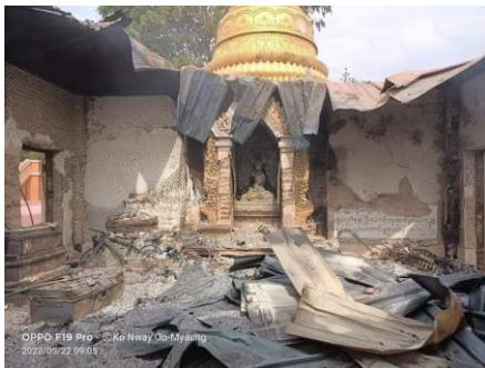
The remains of a Buddhist temple in Sagaing’s Min Tan Village after the regime’s raid in May.

U Yee Mon, the National Unity Government’s (NUG) defense minister, said the military regime burns down villages in order to dismantle the revolution and divide the public from the revolutionary forces. He admitted that the villages have not been adequately protected by the NUG’s defense ministry.