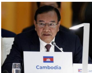
A file photo of Cambodian Foreign Minister Prak Sokhonn, who serves as ASEAN Special Envoy to Myanmar.

“Cambodia stands by the pressure being applied by ASEAN. If it comes to nothing during the trip the feeling will be that the Special Envoy cannot do anything effectively in his visit.”