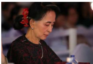
Aung San Suu Kyi at Yangon Photo Festival on March 11, 2017 RFA

ASEAN Special Envoy Prak Sokhonn will not be allowed to meet with Aung San Suu Kyi on his second visit to Myanmar, military council spokesman Gen. Zaw Min Tun told RFA.