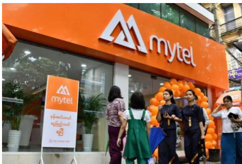
A Mytel showroom in central Yangon draws visitors.

Campaign group Justice for Myanmar has called targeted sanctions against Telecom International Myanmar Company Limited, the company that operates the Mytel network because they are complicit in the military's crimes against humanity.