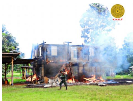
A member of the KNDF is seen walking past a burning building within the church compound in Daw Ngay Khu after a junta attack

The military council has repeatedly denied responsibility for arson attacks on homes and religious buildings nationwide.