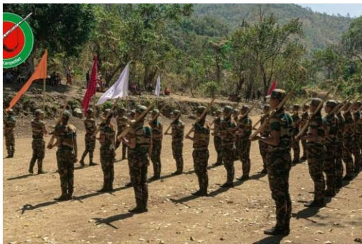
CDF Kanpetlet troops in training

As many as 2,500 people have been forced from their homes by recent clashes between regime and resistance forces in Chin State's Kanpetlet Township, according to a local priest.