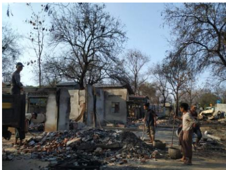
Lat Yet Ma Village in Magwe after being torched by regime troops in May.