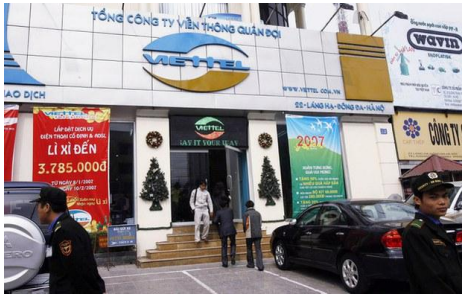
A Viettel store in Hanoi.

Viettel is owned by Vietnam's defense ministry and VGI holds a stake in Telecom International Myanmar, which runs mobile company Mytel.