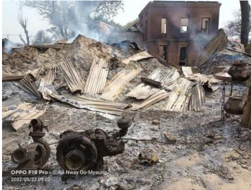
Sagaing’s Min Tan Village after the junta’s arson attack in May.

“We hate military dogs. We had to struggle very much to build our houses,” said a villager from Magwe’s Gangaw Township.