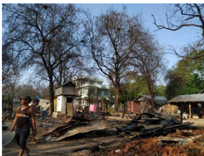
Lat Yet Ma Village in Magwe after being torched by regime troops in May.

In May alone, over 6,000 houses in Sagaing were torched, including Ko Zin Moe's house in Min Tan Village in Myaung Township.