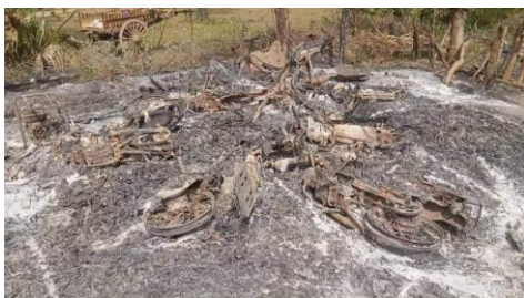
Lin Sar Kyet Village in Salingyi Township.

Lin Sar Kyet Village has some 300 households, and more than 200 houses were burned down. With nearly 100 villagers held hostage, resistance fighters were unable to attack the junta soldiers, said a PDF fighter from Salingyi Township.