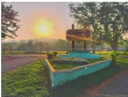
မိုင်းတုံမြို့

“အစကတော့ အဖေဖြစ်သူကို မသင်္ကာလို့လာစစ်တာပေါ့။ သူ့အဖေဆီမှာ ဘာပြစ်မှုမှမတွေ့ပေမယ့် သူ့သမီးရဲ့ဖုန်းကို စစ်တဲ့အခါကျတော့ PDF တွေအတွက် ထောက်ပံ့လုပ်ပေးတဲ့ စာရင်းတွေ၊ ငွေကြေးကောက်ခံလှူပေးတာတွေကို တွေ့သွားလို့ သူတို့ နှစ်ယောက်လုံးကို ဖမ်းသွားလိုက်တယ် ” ဟု မိုင်းတုံမြို့မှ ဒေသခံအမျိုးသမီးတစ်ဦးက သျှမ်းသံတော်ဆင့်ကို ပြောသည်။