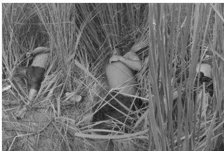
The bodies of the murdered Ta Ohn villagers

Junta forces reportedly killed 10 villagers, including two children, in recent days in Sagaing Region, where the military continues to carry out fierce assaults on the civilian population in an attempt to overpower the resistance stronghold.