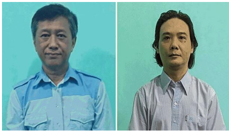
Myanmar democracy activist Ko Jimmy (L) and former Myanmar lawmaker Phyo Zeya Thaw (R) in a combination photo created on June 3, 2022.

In September, the NUG declared a nationwide state of emergency and called for open rebellion against junta rule, prompting an escalation of attacks on military targets by various allied pro-democracy militias and ethnic armed groups.