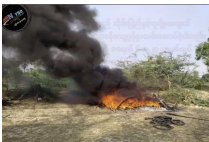
A cremation is held for the bodies of the five victims on June 15

In the days that followed the attack, hundreds of Myanmar army soldiers began raiding the surrounding villages in northern Yesagyo Township, torching homes and abducting civilians.