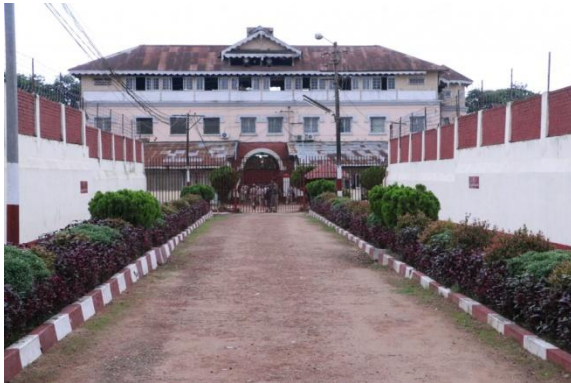
The main building of Insein Prison

Rumours that four condemned prisoners, including prominent political figures Ko Jimmy and Phyo Zayar Thaw, are about to be hanged are untrue, according to a Prison Department spokesperson.