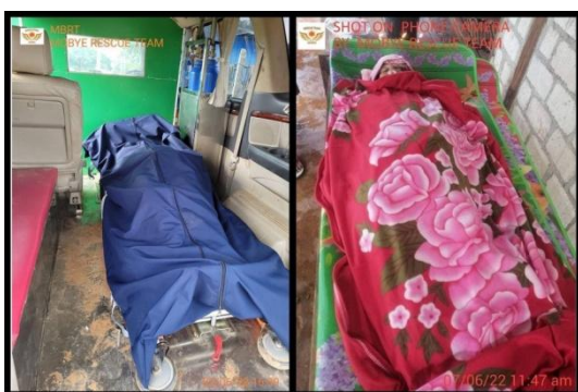
The bodies of two elderly villagers killed by junta shelling in southern Shan State’s Moebye Township on June 7

A full day of fighting in southern Shan State’s Moebye Township left two elderly residents dead on Tuesday after junta forces opened fire on residential areas with artillery fire.