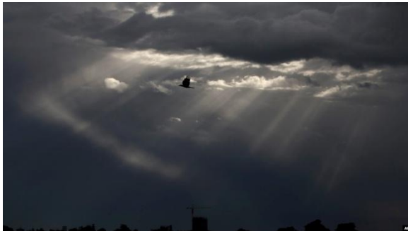
File - The sky over monsoon. Myanmar Monsoon

BANGKOK — Myanmar's nascent monsoon season is likely to give rebels fighting to oust the country's military junta an edge as heavy rains bog down the army's ground forces and hobble its air support for the next few months, analysts say.