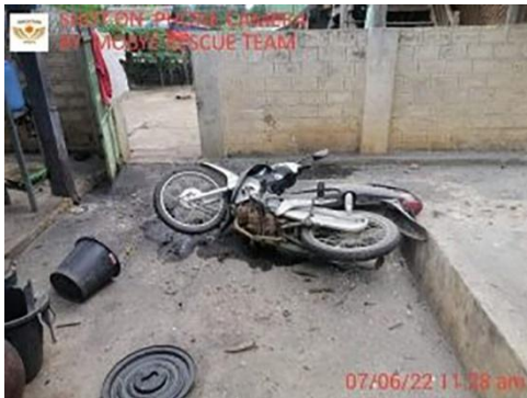
Civilian property damaged by military junta shelling

When SHAN contacted the local PDF force regarding the current situation in the area, it has been confirmed that clashes between the Myanmar army and local PDF occurred but declined to explain the detail situation on the ground.