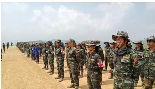
Moe Bye PDF fighters / Moe Bye PDF

Six resistance units including People's Defense Force (PDF) groups in Pekon and Moe Bye, the Karenni Army, the KNDF and the Southern Shan Revolution Youth took part in the fighting.